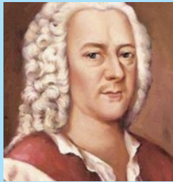
Georg Philipp Telemann (1681 – 1767)

Mo., 5. Februar 2018 20 Uhr | Wolfgang Hoffmann Saal