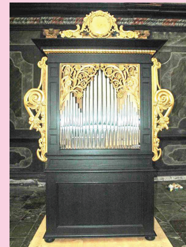
Orgel in Freiburg, St. Ottilien

Meisterkurs, Werkstatt- / Mitsingkonzert, Konzert des Chores und Barockorchesters der Hochschule für Musik Freiburg