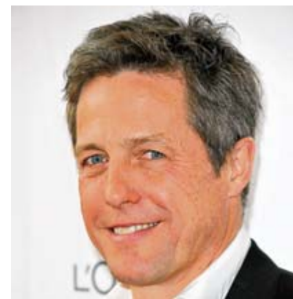
Schauspieler Hugh Grant hätte bei „Bridget Jones 2“ beinahe seinen Text vergessen...