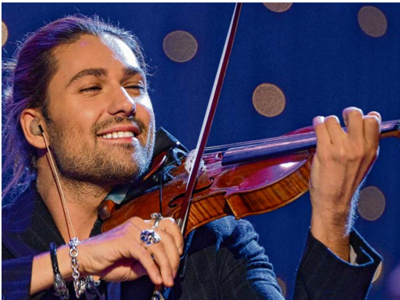
Völlig verzückt: Der deutsche Geigenvirtuose David Garrett kämpft wohl nie mit Lampenfieber.