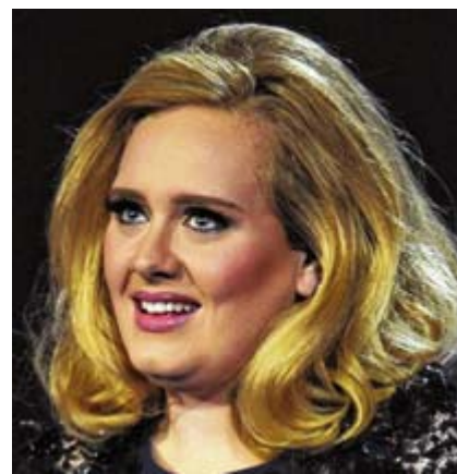
Viele Promis leiden unter Lampenfieber – so etwa die britische Sängerin Adele.