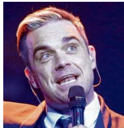
und sogar eine Rampensau wie Robbie Williams kämpft mit Unsicherheit.