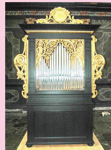
Orgel in Freiburg, St. Ottilien Disposition: Gedackt 8' (Holz) Flöte 4' (Holz) Prinzipal 2' Zinn (C-d' im Prospekt) Quinta 1 1/2' Nasat 3' Tertia 1 3/5'

Meisterkurs, Werkstatt- / Mitsingkonzert, Konzert des Chores und Barockorchesters der Hochschule für Musik Freiburg